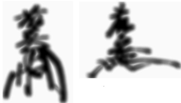
図1 三淵藤英(藤之)の花押