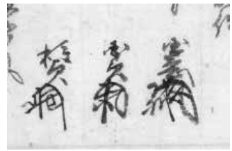
23. 某国憲 (右) 24. 某国貞 (中) 25. 某種貞 (左)