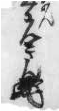
12. 養真庵くわんさん