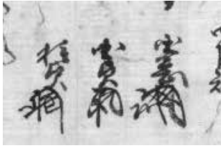
20. 某国憲 (右) 21. 某国貞 (中) 22. 某種貞 (左)