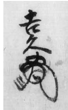
9. (肥塚力) 吉久