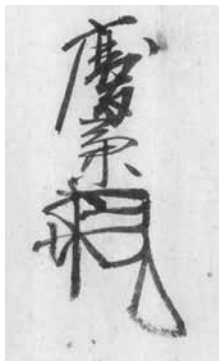
16. (福屋力) 慶兼