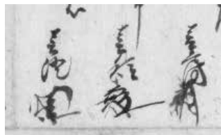
31. 桂春房 (右) 32. 児玉春種 (中) 33. 二宮春澄 (左)