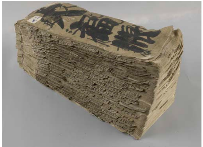
東洋古籍文献研究所蔵「大福帳」(北蝦夷地ア ニワ湾沿岸での日本人商人とアイヌの人々の 交易帳簿): 翻刻・翻訳の共同研究を実施中